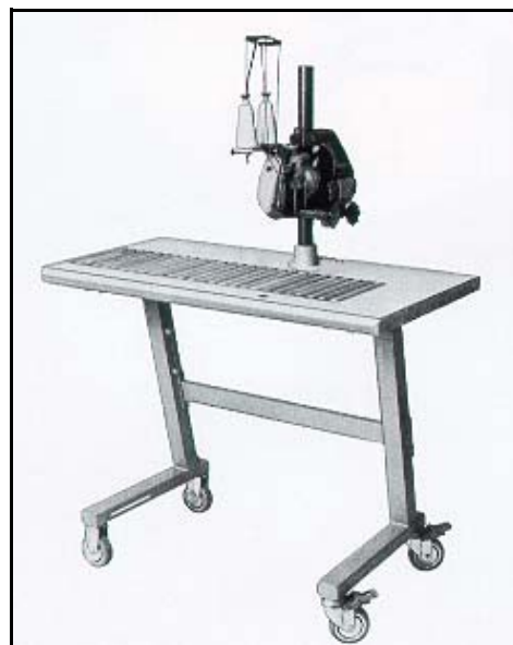
Klasse 2200 AT mit Pedestal H1400T und Stahlprofil Tisch 90709PS

Bestell-Nr. 2103E, zusätzliche Einführvorrichtung zum leichteren Führen der Münzbeutel und der angelegten Fahne (Arbeitserleichterung).