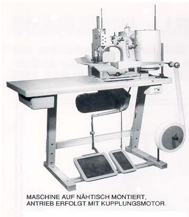
MASCHINE AUF NÄHTISCH MONTIERT, ANTRIEB ERFOLGT MIT KUPPLUNGSMOTOR.