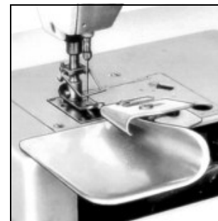
Nähteile und Apparat A9795 verwendet bei 56100TBT